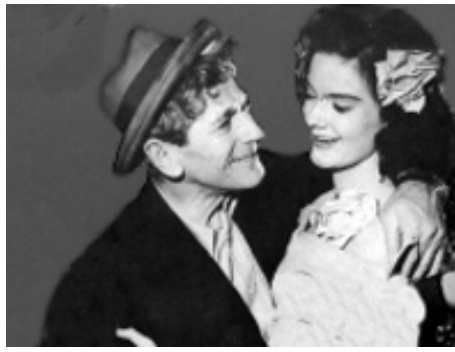
1951 LES MERS QUE NOUS PARCOURONS (Bärande hav) d'Arne Mattsson avec Nils Hallberg