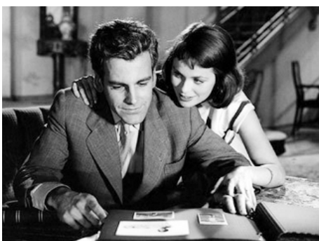
1956 LES DERNIERS SERONT LES PREMIERS (Die letzten werden...) de Rolf Hansen avec Maximilian Schell