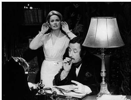
1967 ADOLPHE OU L'ÂGE TENDRE de Bernard Toublanc-Michel avec Philippe Noiret