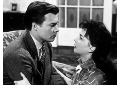
1954 ÉTERNEL AMOUR (...und ewig bleibt die Liebe) de Wolfgang Liebeneiner avec Karlheinz Böhm