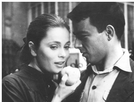
1956 CRIME ET CHÂTIMENT de Georges Lampin avec Gérard Blain