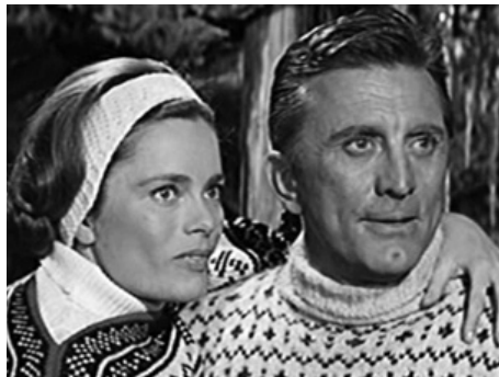
1965 LES HÉROS DE TELEMARK (The Heroes of Telemark) d'Anthony Mann avec Kirk Douglas