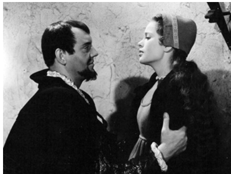
1954 LE TRÉSOR D'ARNE (Herr Arnes Penningar) de Gustaf Molander avec Ulf Palme