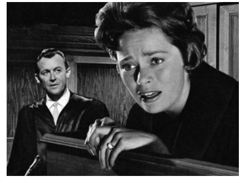
1960 AU NOM D'UNE MÈRE (In Namen einer Mutter) d'Erich Engels avec Claus Holm