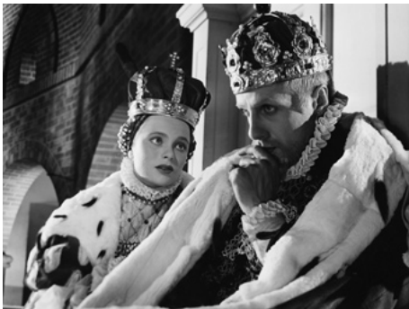
1954 KARIN MANSDOTTER (Karin Månsdotter) d'Alf Sjöberg avec Jarl Kulle