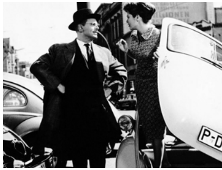
1959 LENDEMAIN DE WEEK-END (Und das am montagmorgen) de L. Comencini avec O. W. Fischer