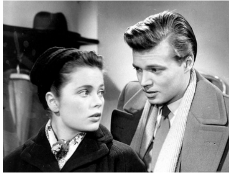
1953 LE PIEUX MENSonge (Die heilige Lüge) de Wolfgang Liebeneiner avec Karlheinz Böhm