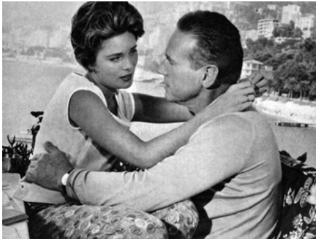
1961 SCANDALE SUR LA RIVIERA (Riviera Story) de Wolfgang Becker avec Wolfgang Preiss