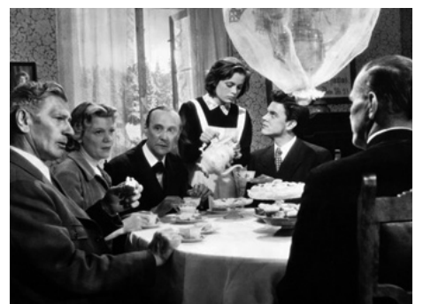
1958 LES CHIENS SONT LÂCHÉS (Unruhige Nacht) de Falk Harnack avec Bernhard Wicki