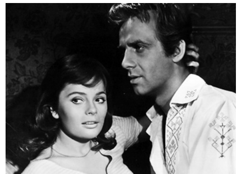
1956 LE CHANT DE LA FLEUR ROUGE (Sången om den eldröda blomman) de G. Molander avec Jarl Kulle