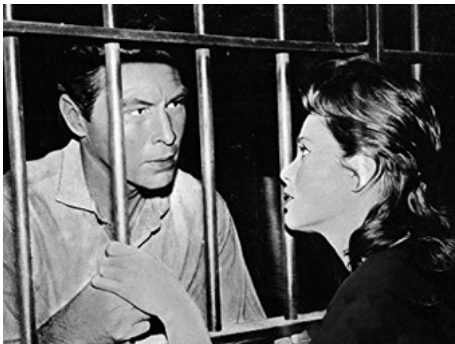
1963 L'HEURE FINALE (The Final Hour) de Robert Douglas avec James Drury