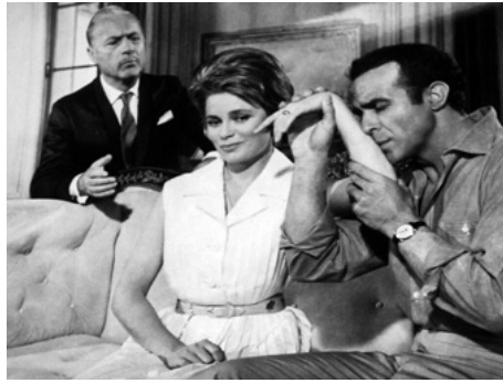
1962 LE GRAND DUC ET L'HÉRITIÈRE (Love is a Ball) de David Swift avec Charles Boyer, Ricardo Montalban