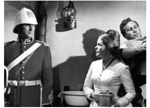
1963 ZOULOU (Zulu) de Cy Enfield avec Stanley Baker