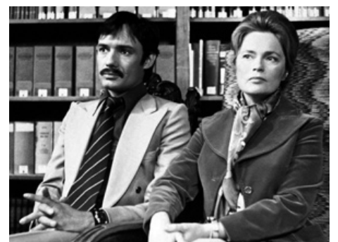
1974 LE DROIT DU PLUS FORT (Faustrecht der Freiheit) de Rainer Werner Fassbinder avec Peter Chatel