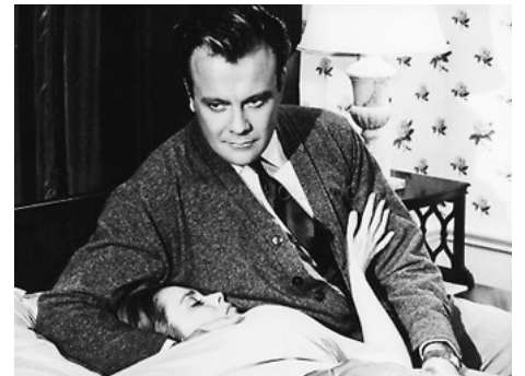
1965 CAUCHEMAR (Nattmara) d'Arne Mattsson avec Gunnar Hellström