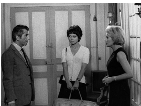
1969 LA SERVANTE de Jacques Bertrand avec Daniel Gélin, France Anglade