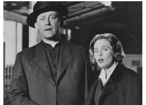
1955 LE PREMIER COMMANDEMENT (Der Pfarrer von Kirchfeld) de Hans Deppe avec Claus Holm